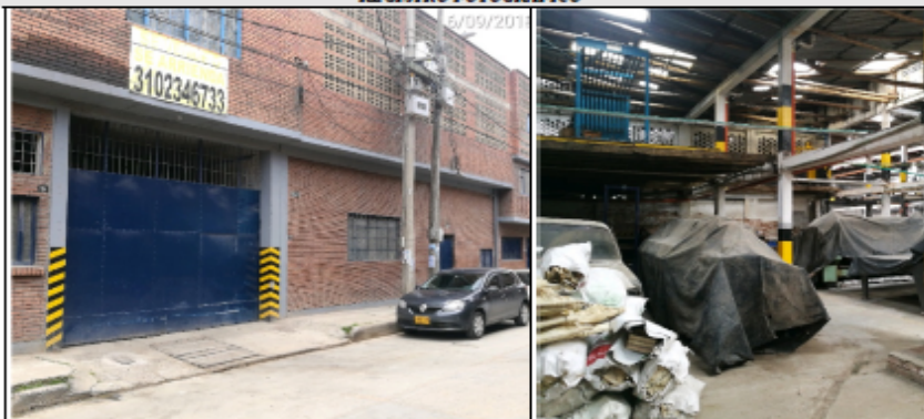
Foto No. 1 Fachada del establecimiento