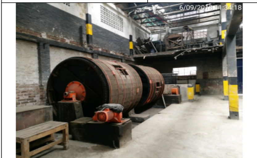
Foto No. 3 Bombos de proceso