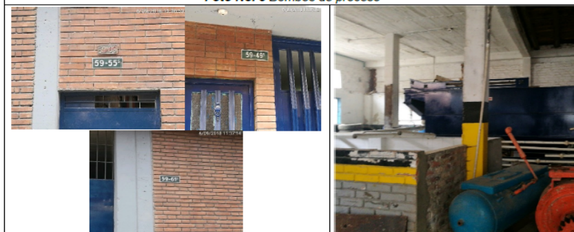
Foto No. 4 Direcciones fachada del establecimiento